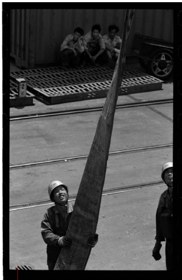
DE HAVEN VAN SJANGHAI De Yang Tse wordt de economische draak van de regio. En Sjanghai is het drakenboofd.

Sjanghai, bijvoorbeeld, is één grote bouwwerf. In tien jaar verschenen er 15.000 gebouwen van meer dan acht verdiepingen, vier bruggen, 200 kilometer autosnelweg en drie tunnels. Plots wordt er rond hele stadswijken een muur opgetrokken, die de afbraakwerken aan het uitzicht van de omwonenden onttrekt. Dag en nacht zijn bouwvakkers in onmenselijke omstandigheden in de weer.