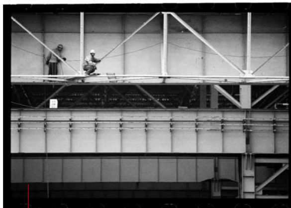
SJANGHAI, EEN GROTE BOUWWERF Vastgoedspeculatie voedt de vraag naar staal, „de motor die de economie naar de afgrond drijft”.

Deze situatie verergert door investeringskredieten van de staatsbanken aan overheden en overheidsbedrijven.